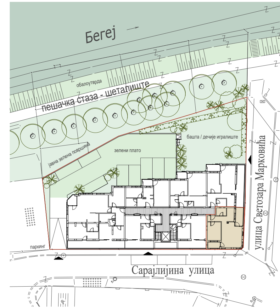
STAMBENI VIŠEPORODIČNI OBJEKAT Su+Vp+2+Ps ul. Sarajlijska, Zrenjanin