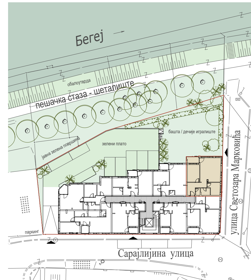
STAMBENI VIŠEPORODIČNI OBJEKAT Su+Vp+2+Ps ul. Sarajlijska, Zrenjanin

Projektant: Stevan Šušak, dipl.inž.arh. "Arhitekt", Zrenjanin