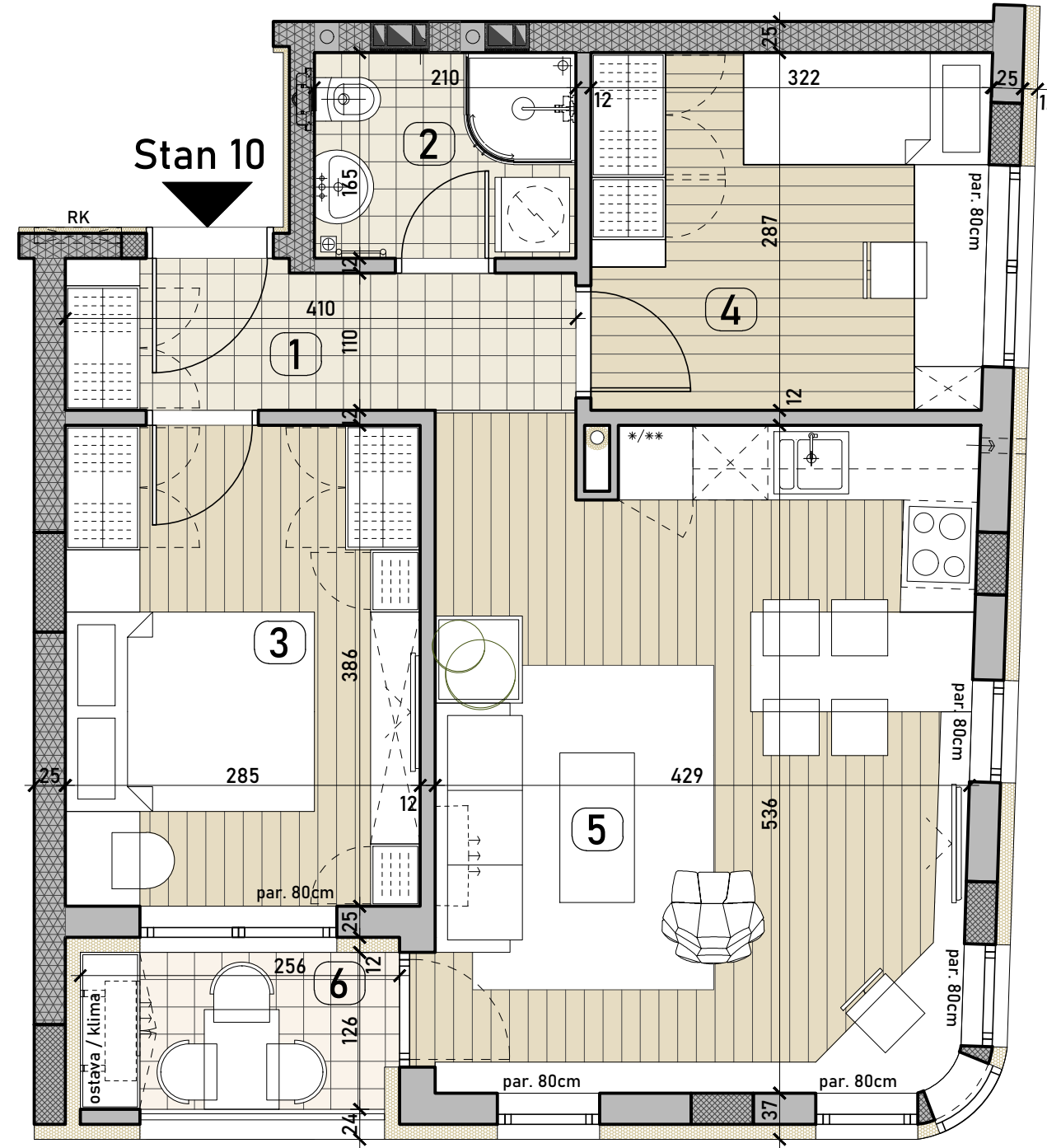
R=1:50 @ A3